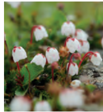
Mossljung Cassiope hypnoides