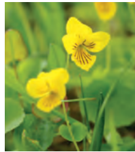
Fjällviol Viola biflora