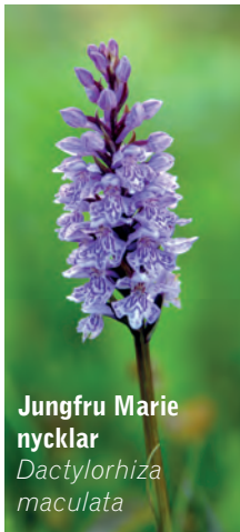
Jungfru Marie nycklar Dactylorhiza maculata