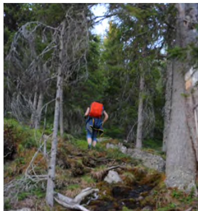
Bitvis är det rejält brant. När det nyss har regnat är det halt.