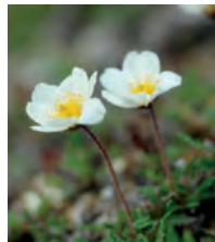
Fjällsippa Dryas octopetala