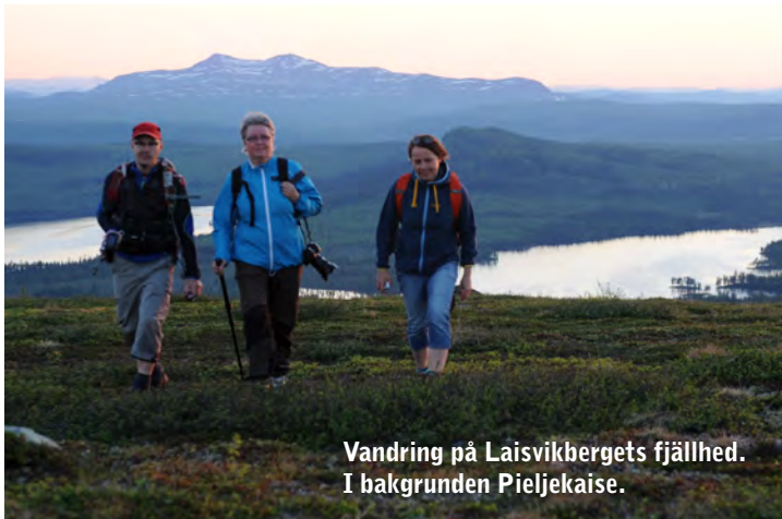
Vandring på Laisvikbergets fjällhed. I bakgrunden Pieljekaise.

Stig: Börjar väl synlig från N Laisvik. Stigen drar snabbt iväg uppåt.