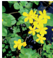
Kabbleleka Caltha palustris