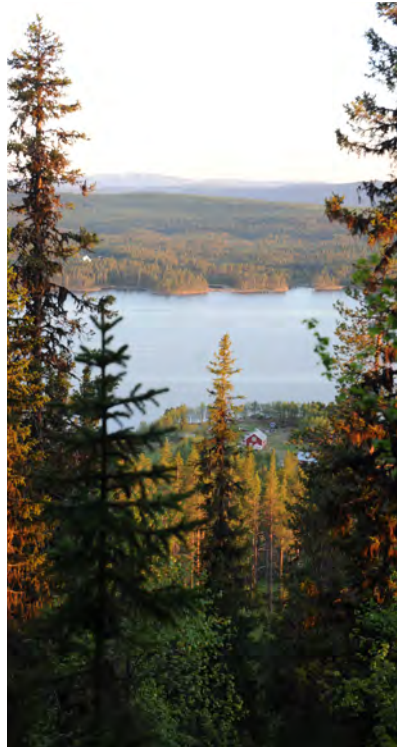
Halvvägs upp skymtas byn Laisvik som har en norr- och en syddel.

Djur: Tjäder, järpe, dalripa, kungsörn, olika falkar, räv, hare, älg och ren tillhör de vanligaste djuren. Mest troligt är att man får syn på – och hör – en ljungpipare. Lo och mård brukar röra sig i sluttningarna, men ses ytterst sällan av vandrare.