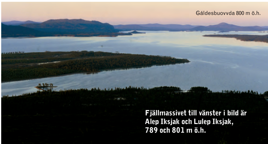
Galdesbuovvda 800 m ö.h.

Fjällmassivet till vänster i bild är Alep Iksjak och Lulep Iksjak, 789 och 801 m ö.h.