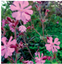
Rödblära Silene dioica

Fjällmassivet till vänster i bild är Alep Iksjak och Lulep Iksjak, 789 och 801 m ö.h.