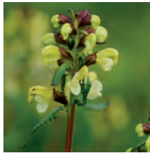
Lappspira Pedicularis lapponica