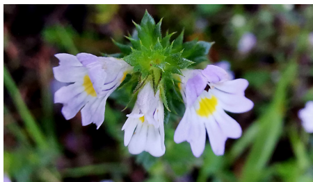
Ögontröst Euphrasia stricta