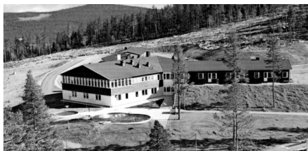
Hotell Silverhatten öppnade 1970.