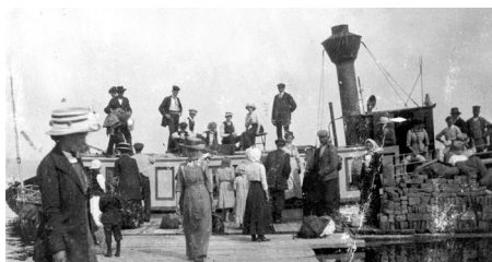
Ångbåtstrafik med Carl XV 1890-talet.