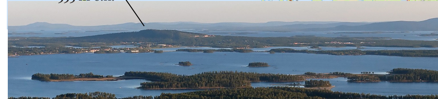
Öberget är 8 km lång och på det bredaste stället 3 km. Foto från Vuornátj.

från Laisvallgruvan. Öbergets östra sida, på en udde som kallades för Skomakarholmen, var länge en utomhusfestplats, men i mitten av 1960-talet fick den ge vika för sporthall med simbassäng. Senare anlas hockeyplan och fotbollsplan. Under 1990-talet byggdes ett Medborgarhus och i samma byggnad öppnades gymnasieskola. Bibliotekets lokaler fick också plats här. En mellanstadieskola tog plats med namnet Öbergaskolan. Idag har den, och högstadieskolan, döpts om till Silverskolan.