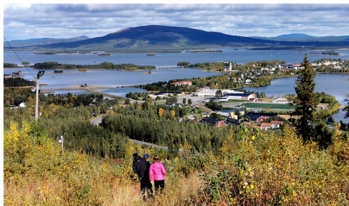
Öberget bjuder på utsikt över Hornavan och Gáldesbuovvda, 800 m ö.h. Stigen i den branta backen är 350 meter lång.

Skydd: Finns inget särskilt skydd eller rastplats på toppen.