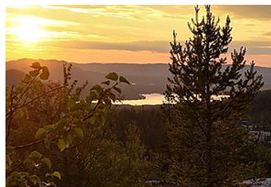
Utsikt norrut kväll.