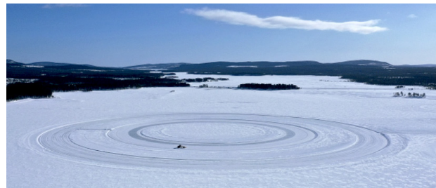
Vintervy: Biltestbana på Hornavan, en av många varianter.

Se mer: Isens Giganter , film om biltestverksamhetens start i början av 70-talet. (30 min, lånas ut av Arjeplogs kommun).