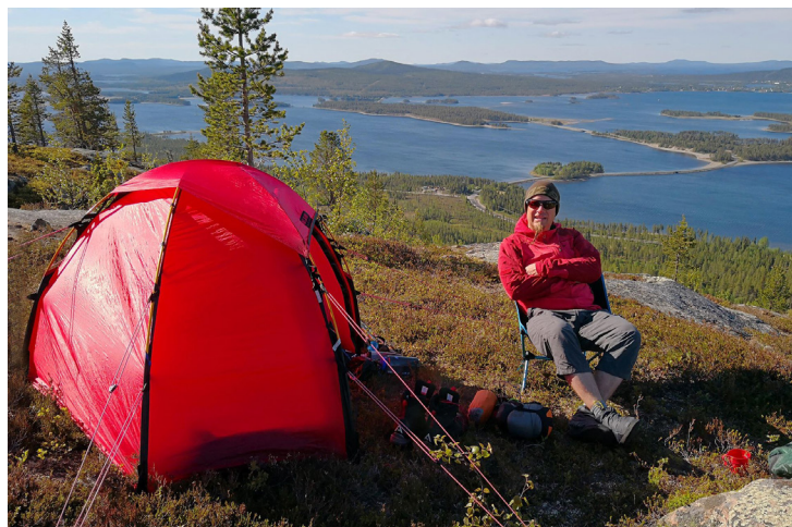
Tälta med fin utsikt, men inte bära så långt? Prova Vuordnátj.

Höjd 652 m ö.h. WGS84 66°6'14.8"N 17°55'26.9"E RT90 (nord, öst) 7335441, 1595818