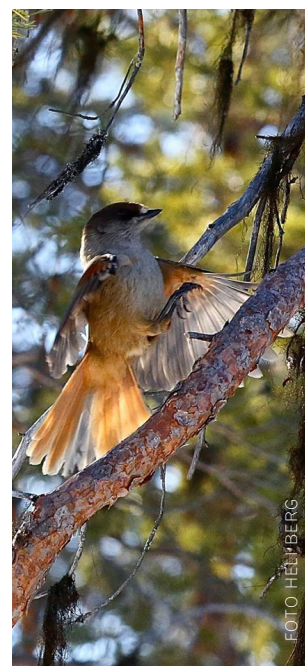
Lavsrikra (Perisoreus infaustus)

Utsikt: Från den rundade toppen breder den fjällnära skärgården ut sig. I första hand kan man se den södra delen av Hornavan med sina angränsade sjöar. Bortom Arjeplogs samhälle finns Uddjaure med fler än trehundra holmar. Från toppen av Vuordnátj ser man Åsarna, en lång sträcka av skogstryggar som bildats av inlandsisen. Området har många förhistoriska lämningar, upp till 7 000 år gamla. Stenålderns jägarfolk fann bo- och jaktplatser här med riklig åtkomst av fisk och vilt. I norr tronar Arjeplogs främsta utflyktsberg, Galtispuoda 800 m ö.h. En del av berget utgör naturreservat. Med ny samisk namnortografi skrivs namnet Gáldesbuovdda .