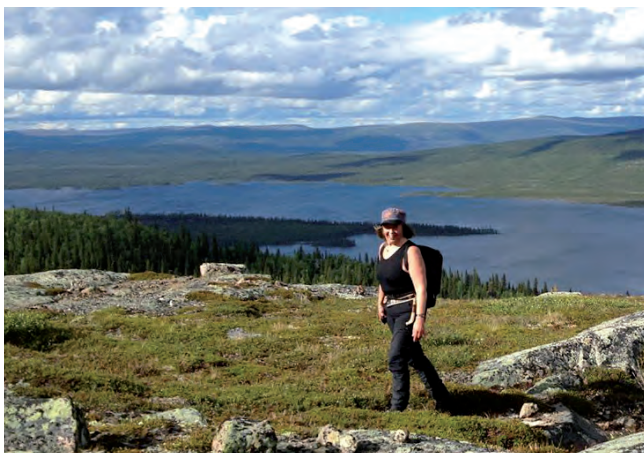
Utsikt från Äjlisvärres nordöstra sida med sjön Stor-Mattaure och fjällområdet Siejdvärre.

Fiskeguide: Arjeplog – en guide till ett fiskeparadis finns på Turistbyrån eller www.arjeplog.se .