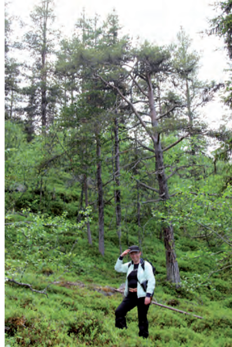
Vid foten av Ájlisvárres finns blandad skog.

Djur: Kring Ájlisvárre finns älg, ren, räv och i mycket sällsynta fall kan man få syn på björn, lo och järv. I det vattenrika älvmrådet var uter tidigare vanlig. Från 1960-talet och framåt minskade stammen drastiskt, troligen på grund av jakt och miljögifter. Utterstammen är dock nu på god väg att återhämta sig också i Piteälvområdet.