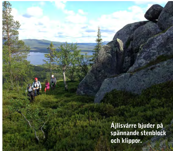
Ájlisvárre bjuder på spännande stenblock och klippor.