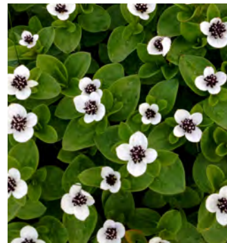
Hönsbär Cornus suecicas