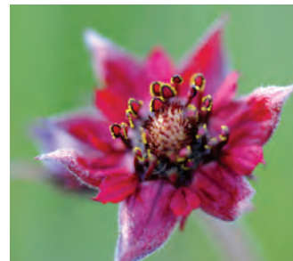
Kråklöver Potentilla palustris